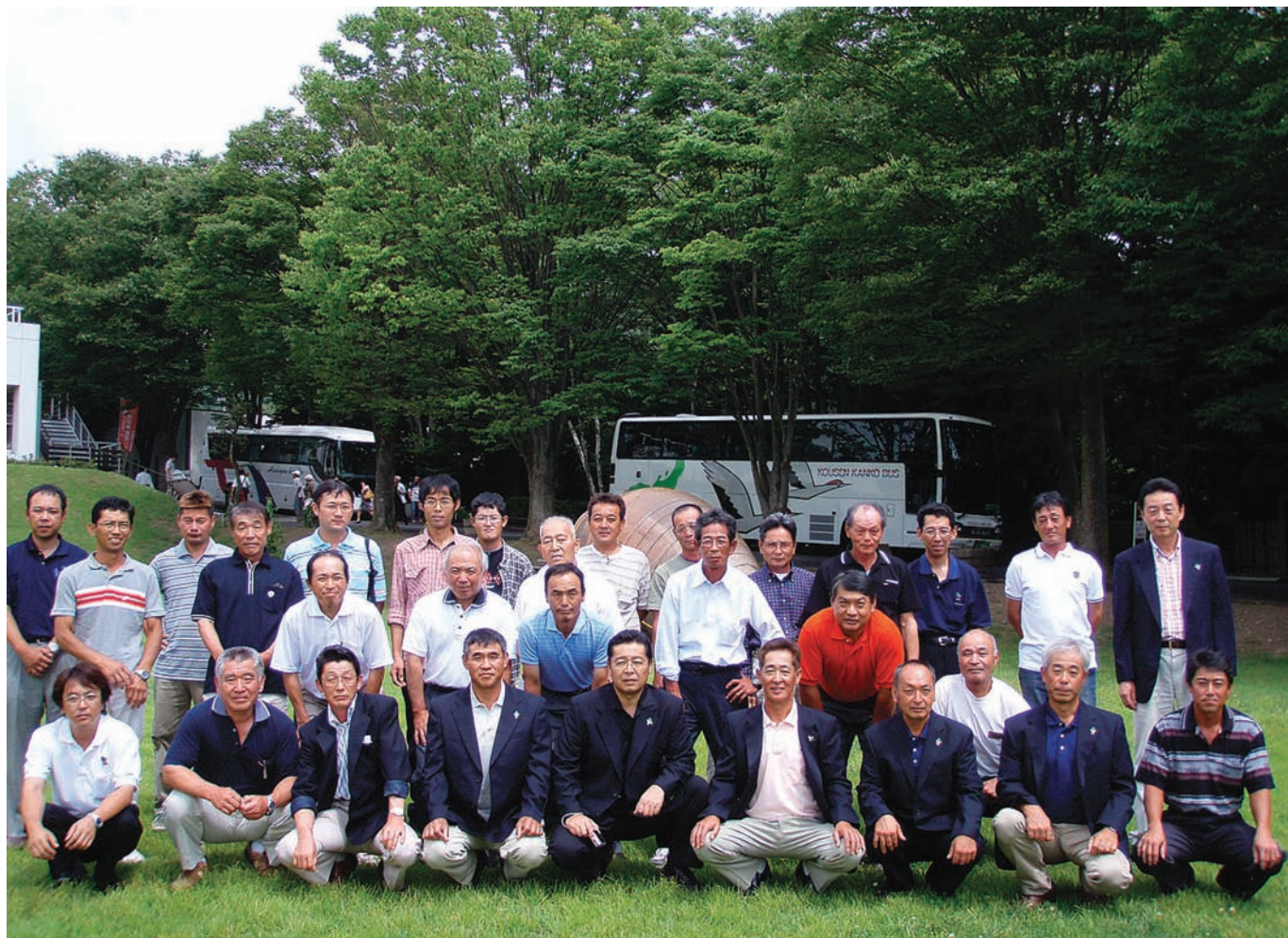
西瓜部視察研修のメンバー（長野県にて）