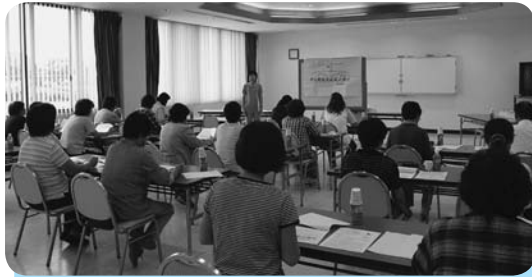
講義に耳を傾ける女性部員

女性部では今後も部員の皆様に愛される組織として役立つ企画をしていきますので、よろしくお願いいたします。