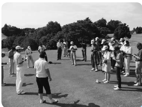
ルール説明を聞く