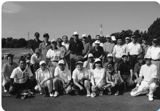
スタート前に皆でカシャ！

第44回組合員ゴルフコンペが8月25日（火）、成田市奈土の長太郎カントリークラブで行なわれました。朝から晴天となり残暑も和らぎ、絶好のゴルフ日和となりました。8組30名が参加者し、つかの間の休日を楽しんでいました。この大会は、日頃のリフレッシュと組合員同士の交流を深め親睦を図ることを目的として行われています。競技は、新ペリア方式で行われ、結果及び各賞は以下のとおりでした。