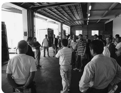
真空予冷施設の説明を受ける

J A西瓜部は8月27日（木）から3日間、長野県で視察研修を行いました。研修初日はJ A長野八ヶ岳の川上村地区を訪れレタスの真空予冷施設や圃場を視察しました。2日目はJ A松本ハイランドでスイカの自動選果施設や長印松本市場を視察して回りました。 西瓜部役員や、支部長、指定市場、全農ちば、J A事務局が出席した反省会では、今年の「富里スイカ」の販売実績の報告や栽培、出荷等の反省点を取り上げ、次年度に向けた生産・販売の方針を協議検討しました。 今年の販売経過としては5月の出荷