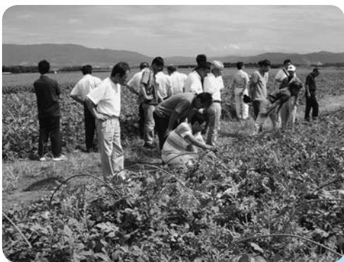
スイカの圃場を視察

J A西瓜部は8月27日（木）から3日間、長野県で視察研修を行いました。研修初日はJ A長野八ヶ岳の川上村地区を訪れレタスの真空予冷施設や圃場を視察しました。2日目はJ A松本ハイランドでスイカの自動選果施設や長印松本市場を視察して回りました。 西瓜部役員や、支部長、指定市場、全農ちば、J A事務局が出席した反省会では、今年の「富里スイカ」の販売実績の報告や栽培、出荷等の反省点を取り上げ、次年度に向けた生産・販売の方針を協議検討しました。 今年の販売経過としては5月の出荷