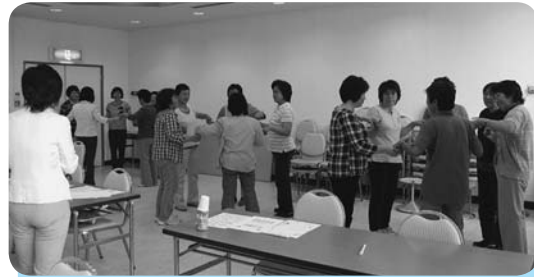
参加者全員で頭の運動