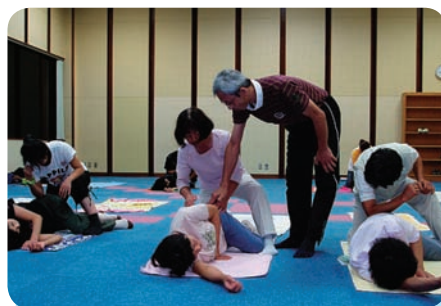
もう少し腰をひねってえ〜