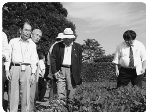
圃場から掘り出し生育状況を確認

今年の一部の圃場で天候不順による生育の遅れが見られたものの8月以降は生育も回復し、概ね平年並みとなりました。