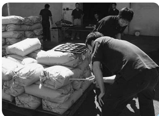
1袋ずつ米を抜いて検査

また清酒「富里」や米焼酎「十三の里」の原料として使われる酒米(総の舞)も出荷され検査を受けました。 本年J A に出荷された新米は4844袋となりました。