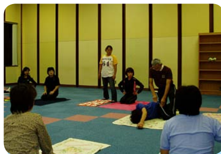
まずは先生に見本を...