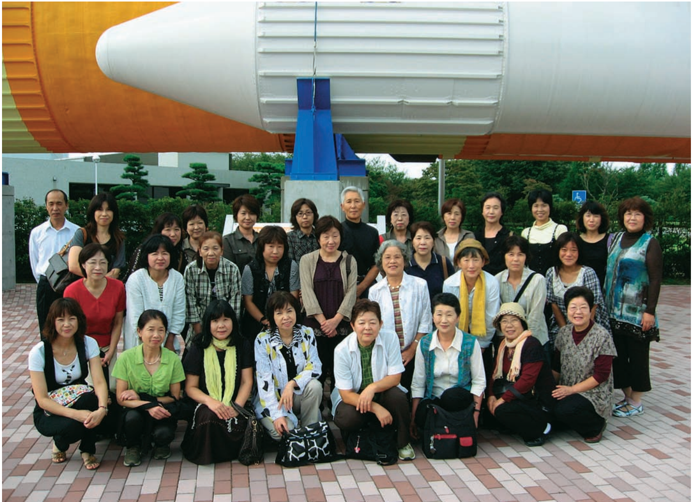
菜の花会視察研修（筑波宇宙センターにて）