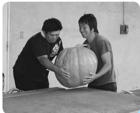
カボチャを計量台の上に…

このカボチャ計量はハロウィンの時期とも重なり需要が多いこともあり、市場に出荷され販売代金は青年部の活動費として充てられています。