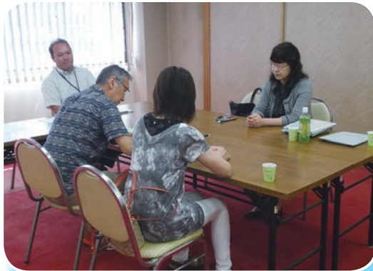
年金支給手続きについて相談