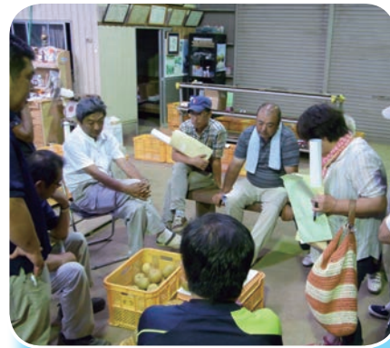
今年の情勢を話し、規格を確認

ファーマーの認定を全員が受けており、化学肥料や農薬の使用低減に取り組み、環境にも配慮しています。