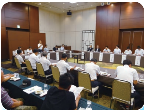
支部長と市場担当者を交えて意見交換