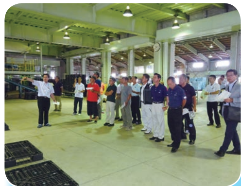
JA金沢市の集出荷場施設を見学