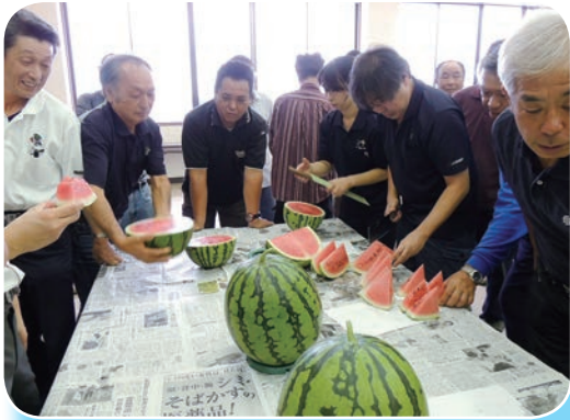
試割りで果肉の状態を確認

抑制栽培の部会、指定品種は「味きらら」と「祭りばやし11(イレブン)」、「紅太鼓」(ベニタイユ)の3種。この日は「味きらら」で現品査定や試割りを行い、果肉の状態や食味などを確認しました。