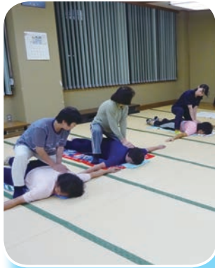
肩甲骨まわりのストレッチ

JA女性部では8月27日(木)、富里市の中央公民館の一室でストレッチ体操を行いました。