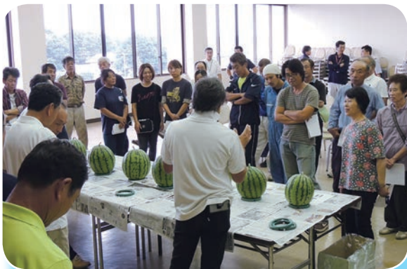
品質管理と出荷基準を確認

9月・10月も暑い日が続けば、需要が見込まれることから、部会では秋のスイカについても「最後の一箱まで、緊張感のある出荷を!」と呼びかけると共に、品質管理の徹底と出荷基準の遵守、出荷報告の励行について生産者と確認しました。