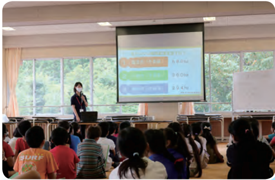
ニンジンの授業をするJA職員

同校の 4 年生は毎年、総合学習で地域の基幹産業である農業について学んでいます。「市町村別の生産量が全国一位を誇るもの、地元でもあまり知られていない秋冬ニンジン」を題材にしたい」と同校が J A に相談し、今回の出前授業が開催されました。