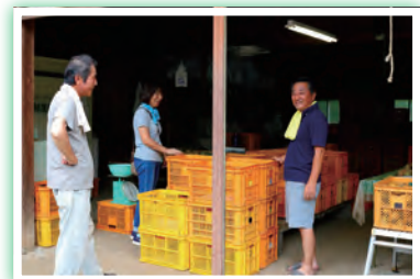
梨を買い求めるお客様

実は先代が梨栽培をしていたのも20年ほどで、元々梨園を経営していた先々が亡くなられた時に、その跡を継ぐ決意をされたそうです。梨園を守るために一念発起した同志とも言えるお二人は、優しい眼差しで梨の話をしてくださいました。