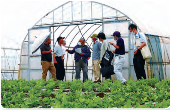
「おおまさりネオ」の圃場を前に検討

この検討会は、ラッカセイ優良種子の安定的な生産と、ラッカセイ農家の技術研鑽及び連絡調整を目的に開催され、共同圃場巡回と研修会を行いました。