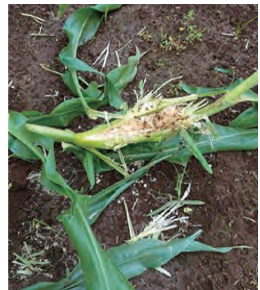
アライグマの被害にあったトウモロコシ