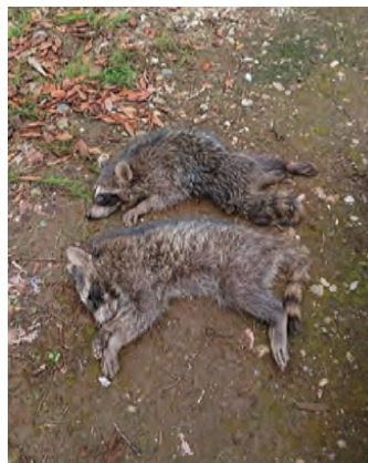
捕獲したアライグマ