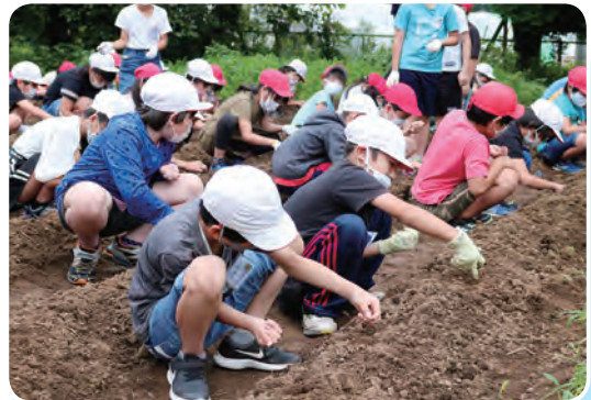
種まきをする児童たち

当日は「富里ニンジンの育て方を学ぼう」と題し、富里のニンジン栽培の概要や、栽培の注意点などについて J A 営農指導課の職員が講義を行いました。児童たちは「ニンジンは何種類あるのか」「春ニンジンと秋冬ニンジンの違いは」「間引き作業はどうやるのか」など熱心に質問をしていました。その後「ベーター44」のコート種子を用いて、手指先ほどの穴を空け、丁寧に種を蒔いていきました。