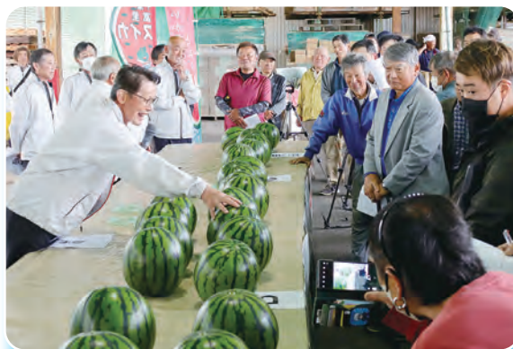
厳しい生育環境の中、安堵の表情も