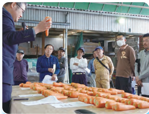
形状、長さ、傷など規格を丁寧に確認

春ニンジンは夏季の高温下では品質低下の傾向が見られることから、有利販売につなげるためにも6月末までの切り上げりが望ましく、市場関係者からも計画的な出荷が呼びかけられました。