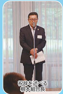
祝辞を述べる 根本組合長