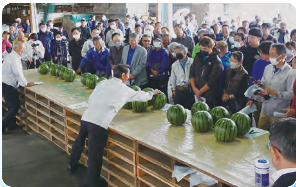
多くの生産者らが集まりました

今年 は 交 配 時 期 の 天 候 不 順 に よ る 生 育 の 遅 れ で 小 玉 傾 向 が 見 ら れ る な ど 出 だ し は や や 鈍 め で し た が、現品査定で試割りしたスイカは中