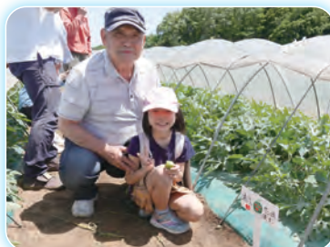
自分たちで選んだ株の前に札を設置

札付け作業後は、収穫したてのスイカの試食や今後の成長過程について説明がされ、参加者は6月末の収穫に胸を膨らませていました。