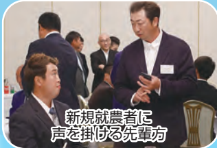
新規就農者に声を掛ける先輩方