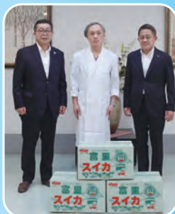
龍岡クリニックにて

根本実組合長と五十嵐博文市長は5月16日(木)と21日(火)に、成田赤十字病院、国際医療福祉大学成田病院、日吉台病院、成田富里徳洲会病院及び龍岡クリニックの近隣5つの病院を訪問し、「富里スイカ」を贈呈しました。