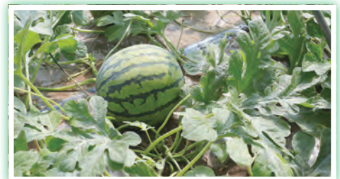
順調に育っている「祭ばやし」

農業に対して、自然相手の仕事であり体力面でハードな印象を持っていたそうですが、就農してからは経営面での難しさにも気づいたと言います。「全ては自分の責任。数字の面も含め中長期的に考えなければ」と課題感を持ち、劇団を運営していた経験も振り返りながら、前向きに農業に取り組んでいます。