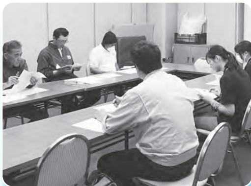
他産地の品種に関する情報提供も