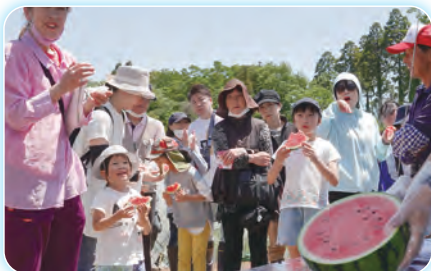
採れたてのスイカも味わいました