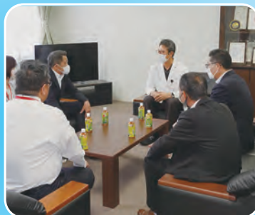
成田富里徳洲会病院にて