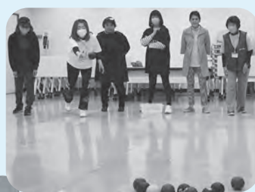
ボッチャの練習風景