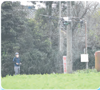
農業用ドローンで葉面散布

今回は2回目の散布となり、ドローンプロフェッショナルサービス株式会社が操作するドローンを根を太らせる効果のある液肥を散布しました。