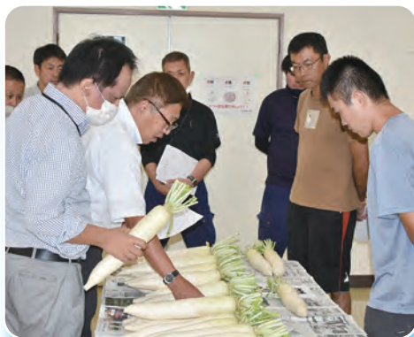
ダイコンの規格を確認する生産者