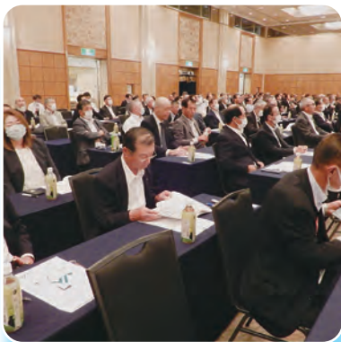
講義を受ける役員

当日は16人が参加し、「JABANK基本方針について」や「不祥事未然防止のための経営管理・内部統制」等の講義に真剣に耳を傾ける姿が見られました。