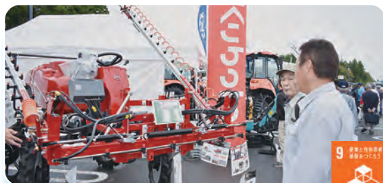
農機を見学する来場者

展示されている農機を実際に乗ったり、動かしたりして興味を持って見学している来場者の姿が多く見られました。