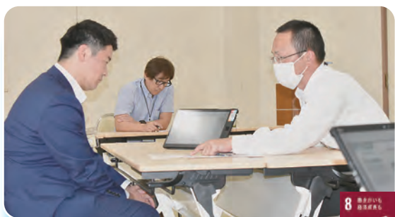
審査を受ける職員