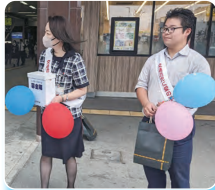
募金をよびかけるJA職員