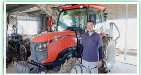
GPS搭載のトラクター