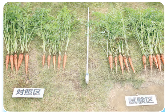
対照区と試験区の比較

散布した圃場の生産者は「ドローンの葉面散布は散布時間が早くて驚いた」と話していました。