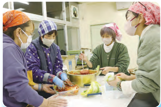
キムチの素を塗って漬け込みます

参加者は「家でも作ってみたい」「みんなでワイワイと美味しいキムチを作って、忙しい時期に息抜きになった」などと笑顔で話していました。