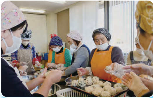
愛情を込めて料理を作るメンバーたち