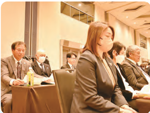
真剣に耳を傾ける役職員