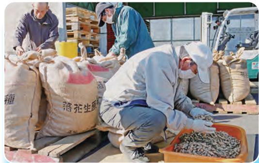
種子の状態を丁寧に確認