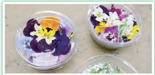
スイーツ等の彩りに添えられるエディブルフラワー（食用花）