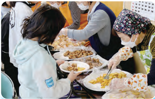
手作り料理に列を作る子どもたち