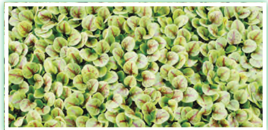
仏料理のアクセント等で使われる「オゼイユ」

栽培方法が確立されていない西洋野菜に取り組みにあたっては、海外のYouTube動画やGoogleマップのストリートビューを活用しました。「イタリア野菜は地名を冠していることが多く、その地方での栽培風景を見て学んだ」と話します。