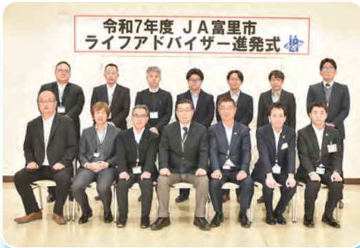
組合員・利用者の皆様のために頑張ります