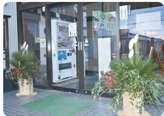
門松が飾られた正面玄関

昨年に続き門松を飾らせていただいた事で、玄関が華やかになり、職員一同感謝申し上げます。