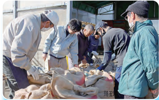
持ち込まれた種子は全量合格

今回の種子検査の他、発芽試験、DNA 検査が実施されており、合格した種子は2月以降に販売されます。